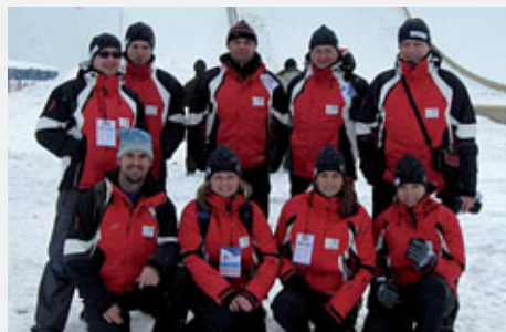
Organizační výbor EYOWF 2011

Šest dnů trvající soutěže EYOWF 2009 v polských Beskydech sledovala pečlivě delegace zástupců Libereckého kraje a členů organizačního výboru festivalu 2011.