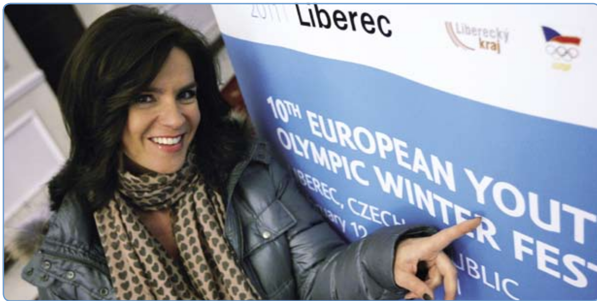
Legendární krasobruslařka Katarina Wittová ozdobila evropskou olympiádu mládeže 2011

Dnes se Katarina plně koncentruje na ZOH 2018. Coby „agentka u jménu Mnichova“ už loni navštívila světovou olympiádu mládeže v Singapuru, teď je na EYOWF 2011 v Liberci. Dělá vše proto, aby letos 6. července při volbách v Durbanu získala své další velké vítězství: Aby se Mnichov za sedm let stal dějištěm ZOH. Byl by tak prvním městem v historii, kde by se konaly letní (1972) i zimní Hry (2018).