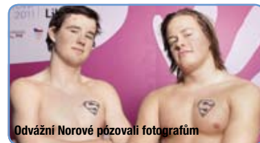
Odvážní Norové pózovali fotografům

to je na všech turnajích nuda. Tady potkáme nejen Finy, ale i ostatní, prostě paráda,“ pochválil zábavní centrum trenér finských skokanů Tuomas Virtanen . Pokud si chtějí sportovci odpočinout, je jim k dispozici i tmavá relaxační místnost, kde se promítají filmy nebo hraje hudba na přání. Surfovat po internetu mohou kdekoli, celá Fun zóna je pokryta wi-fi signálem.