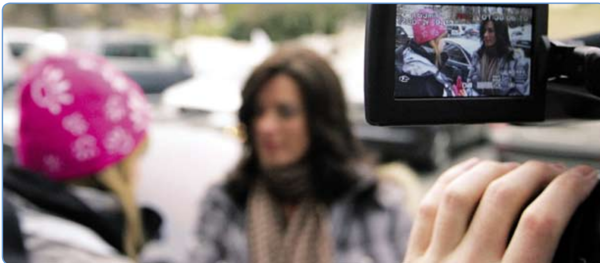
The legendary figure skater Katarina Witt caused a great stir among the media in Liberec

Today Katarina concentrates totally on the Winter Olympics of 2018. As an “agent in the name of Munich”, she visited the Youth Olympic Games in Singapore last year, now it is EYOWF 2011 in Liberec. She does the best she can to celebrate another victory in the vote on 6th June in Durban: that Munich becomes the host of the Winter Olympic Games. It would be the first city in history to hold both the Summer (1972) and Winter (2018) Olympic Games.