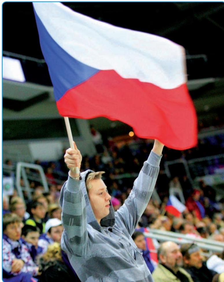
Čeští fanoušci dokáží sportovce povzbudit