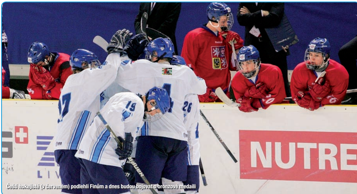
Čeští hokejisté (v červeném) podleli Finům a dnes budou bojovat o bronzové medaili

na 1:2. Kontaktní gól domácí tým povzbudil. Při přerušení je DJ v TipSport areně hnal do útoku dunivými skladbami skupin Kabát a Rammstein. Jenže finské přesilovky český nápor zastavily. Když mezinárodní sudí Minář zdvihl paži na znamení vyloučení dalšího českého hráče, vstřelili Finové v šesti třetí rozhodující gól. Češi se ještě dvě a tři čtvrtě minuty před koncem pokusili za stavu 1:3 v power play o zázrak, ale záhy inkasovali do své prázdné branky po čtvrté. Český sen o finále se tím definitivně rozplynul.