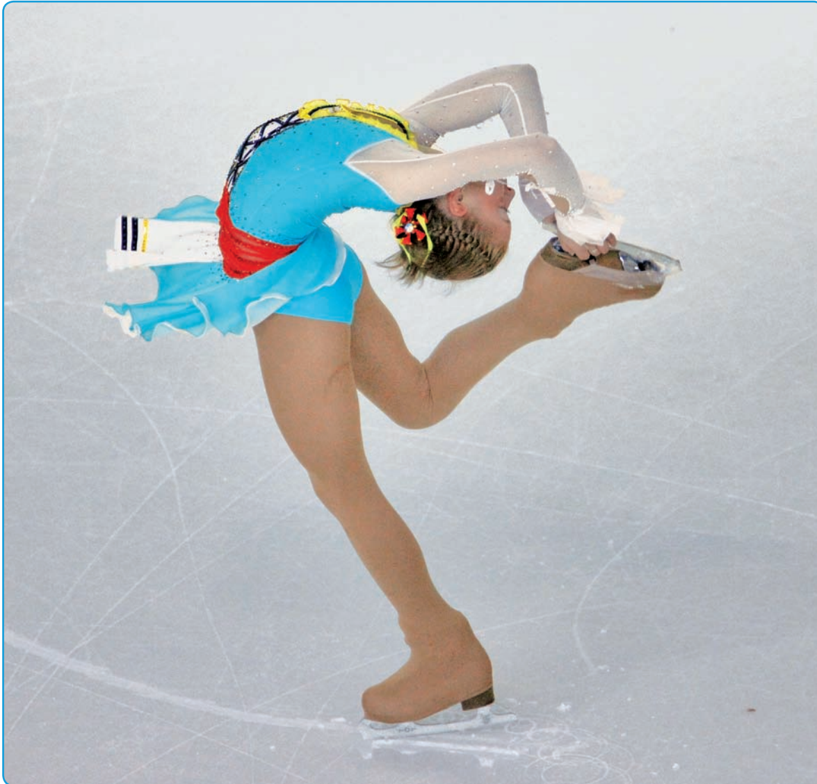
Russian figure skater Polina Agafonova collected gold in the Svijanská Arena