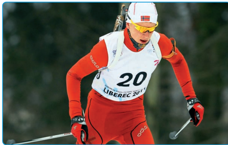
Johannes Bø from Norway won the 7.5 km Biathlon race

Czech participant, finishing 15 th on this occasion. "I am totally happy with my performance. I had minor technical problems in the first shooting and I am sorry about the last shot from the standing position. The cross country ski section was brilliant though." One and a half kilometres shorter; the girls' race opened with 78 athletes from 26 European countries. Just as in Monday's individual race, the sprint was won by German, Laura Dahlmeier. "Everything turned out the best for me in this race, my shooting was excellent and so was my skiing. This victory really means a lot to me. I have proven that my initial victory was no accident."