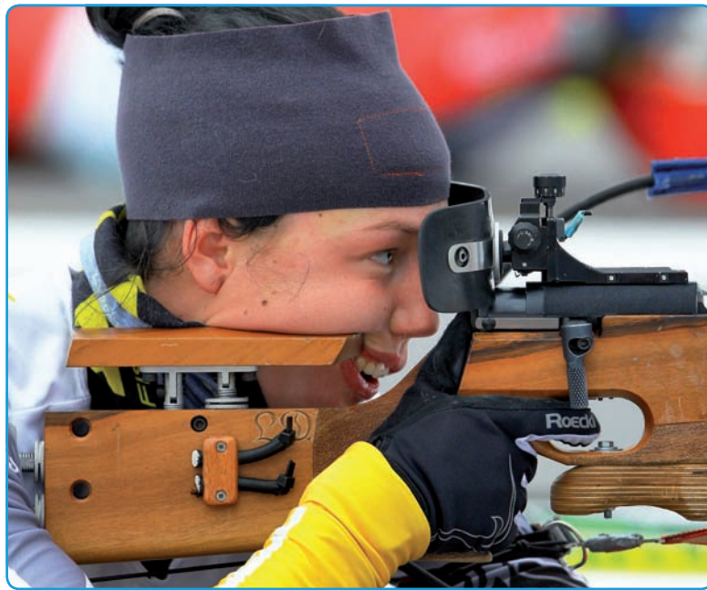
Nejlepší biatlonistkou v závodě na šest kilometrů se stala Němka Dahlmeierová

Stejně jako při pondělním individuálním závodě dominovala i sprintu Němka Laura Dahlmeierová. „V závodě mi vyšlo opravdu všechno, výborně jsem zastřílela a běžela jsem také dobře. Tohle vítězství pro mě hodně moc znamená. Dokázala jsem, že moje úvodní vítězství nebylo náhodné.“