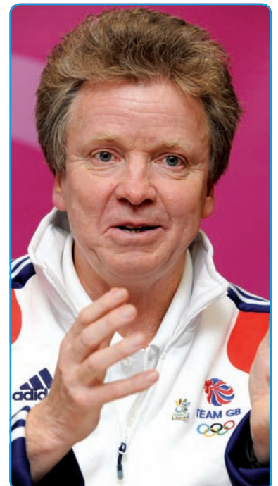
Lord Colin Moynihan

„Je pravda, že Tarjei jezdí letos v úžasné formě, tvrdě na sobě pracuje a přináší mi to výsledky. Jednou bych chtěl být jako on. Občas spolu trénujeme, ale je na mě ještě moc rychlý (smích). Občas mi poradí, co dělám špatně a co bych měl zlepšit, má už přeci jenom více zkušeností než já. Musím na sobě dál pracovat a věřím, že jednou spolu budeme vyrovnaně bojovat ve Světovém poháru.“