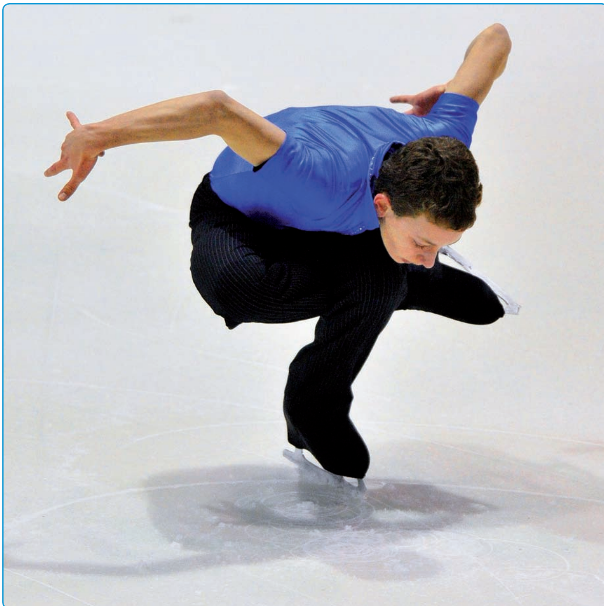
Krasobruslař Petr Coufal, český hrdina, získal po svém životním výkonu fantastickou zlatou medaili