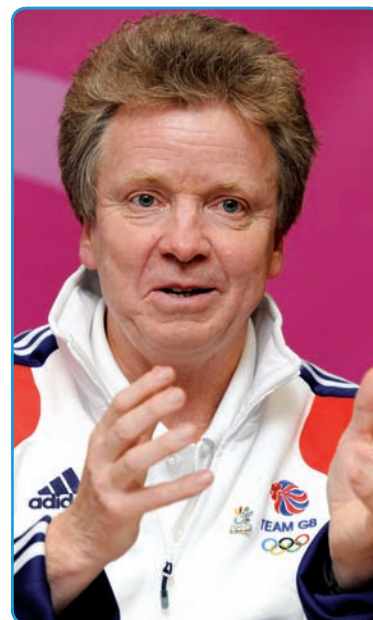
Lord Colin Moynihan

I arrived in Liberec two days before the Festival in order to take part in a conference on youth sport. My daily programme is linked with the British delegation. I accompany the athletes to the venues, I have taken part in meetings and we are having a common dinner with our athletes on Friday in the Olympic Village.